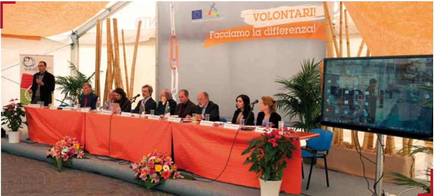
Trento - Piazza Fiera - Anno Europeo del Volontariato.

fondamentale per migliorare i servizi e renderli più efficaci ed efficienti.