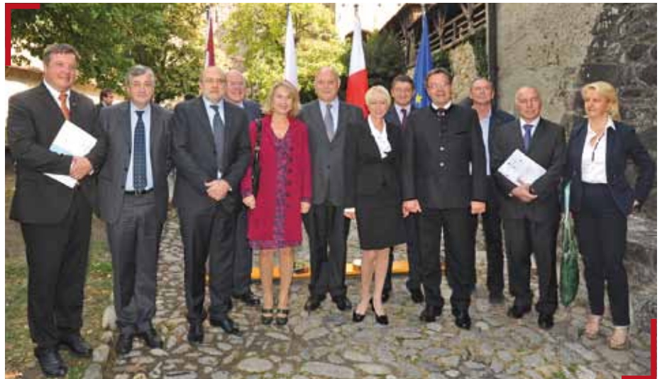
I componenti dell'Assemblea dell'Euregio riuniti a Castel Tirolo lo scorso ottobre

Il progetto dell'Euregio, in altre parole, è una garanzia di rafforzamento della nostra Autonomia entro un ambito territoria-