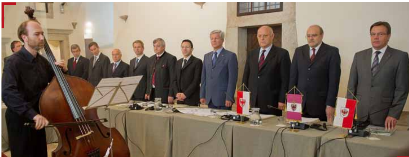
L'incontro delle tre Giunte dell'Euregio a Castel Thun

A questo si deve aggiungere, con specifico riferimento alla nostra situazione, che la dimensione del Trentino, anche se unita all'Alto Adige, rimane pur sempre troppo piccola per confrontarsi con un regionalismo europeo che ha dimensioni, mediamente, molto più consistenti. In più, alla dimensione regionale manca la parte a nord del corridoio del Brennero che si congiunge con la valle dell'Inn a Innsbruck: tre territori, quindi, che hanno le stesse caratteristiche geografiche, sociali ed economiche che per essere adeguatamente tutelate e valorizzate non possono