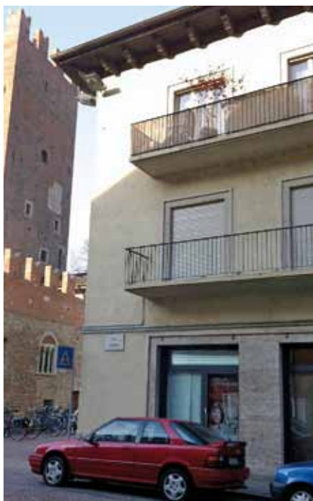
La nuova sede del partito Via Roma, 7